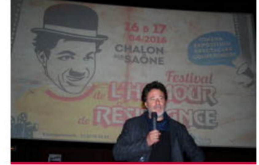
CHALON - FESTIVAL DE L'HUMOUR ET DE LA RÉSISTANCE "La comédie, pour faire rire et réfléchir"

RUGBY - AVENIR Le projet X de Damevin TOUS LES ARTICLES