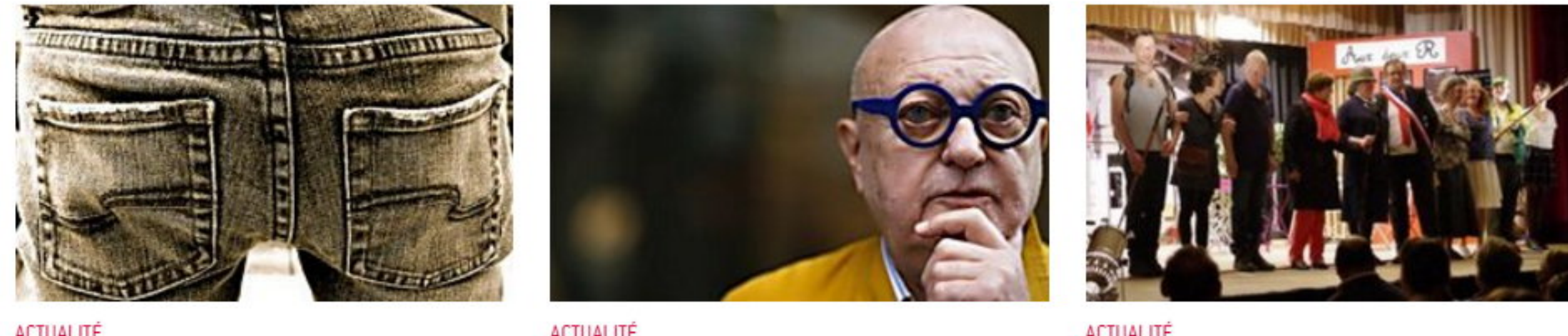
ACTUALITÉ Il pète, elle porte plainte pour atteinte à la pudeur ACTUALITÉ Tout ce que vous ne saviez pas sur Jean-Pierre Coffe ACTUALITÉ Le public répond présent pour la pièce 30 Km à pieds